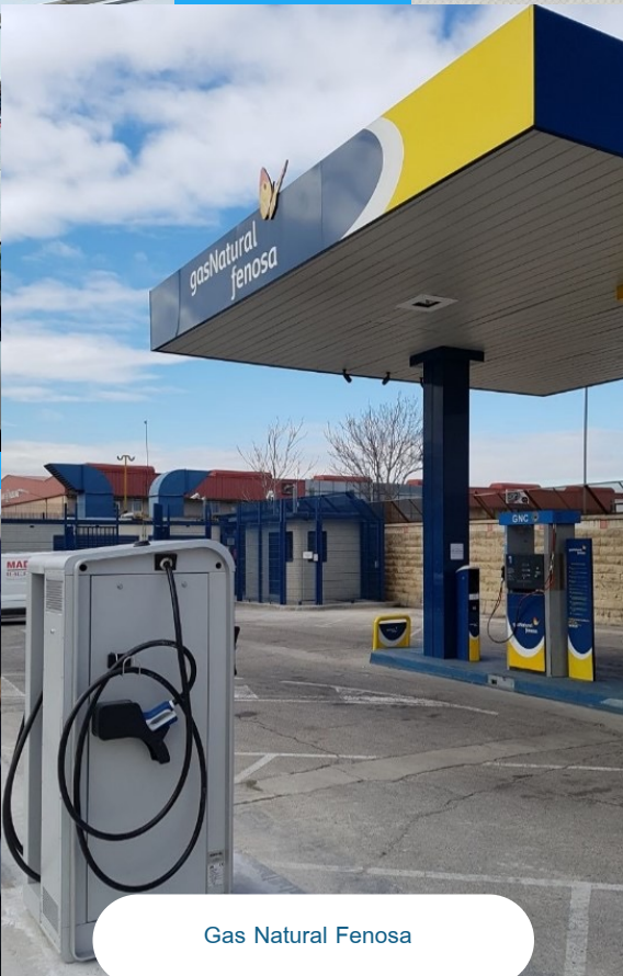
Gas Natural Fenosa